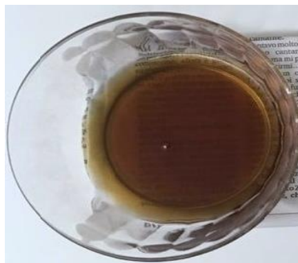
PREPARAZIONE NON ADEGUATA

Di seguito si riportano le indicazioni da osservare scrupolosamente.